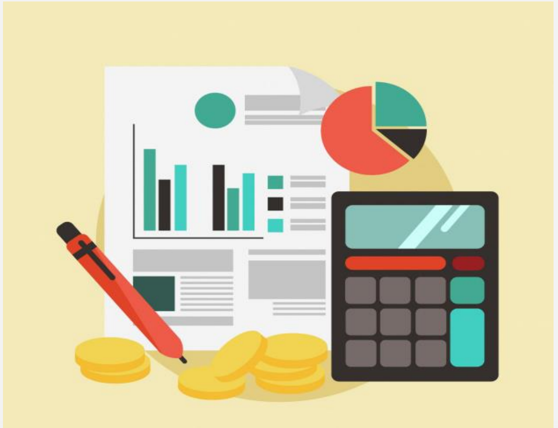
Tablo - 7. Gelir-gider bilgileri